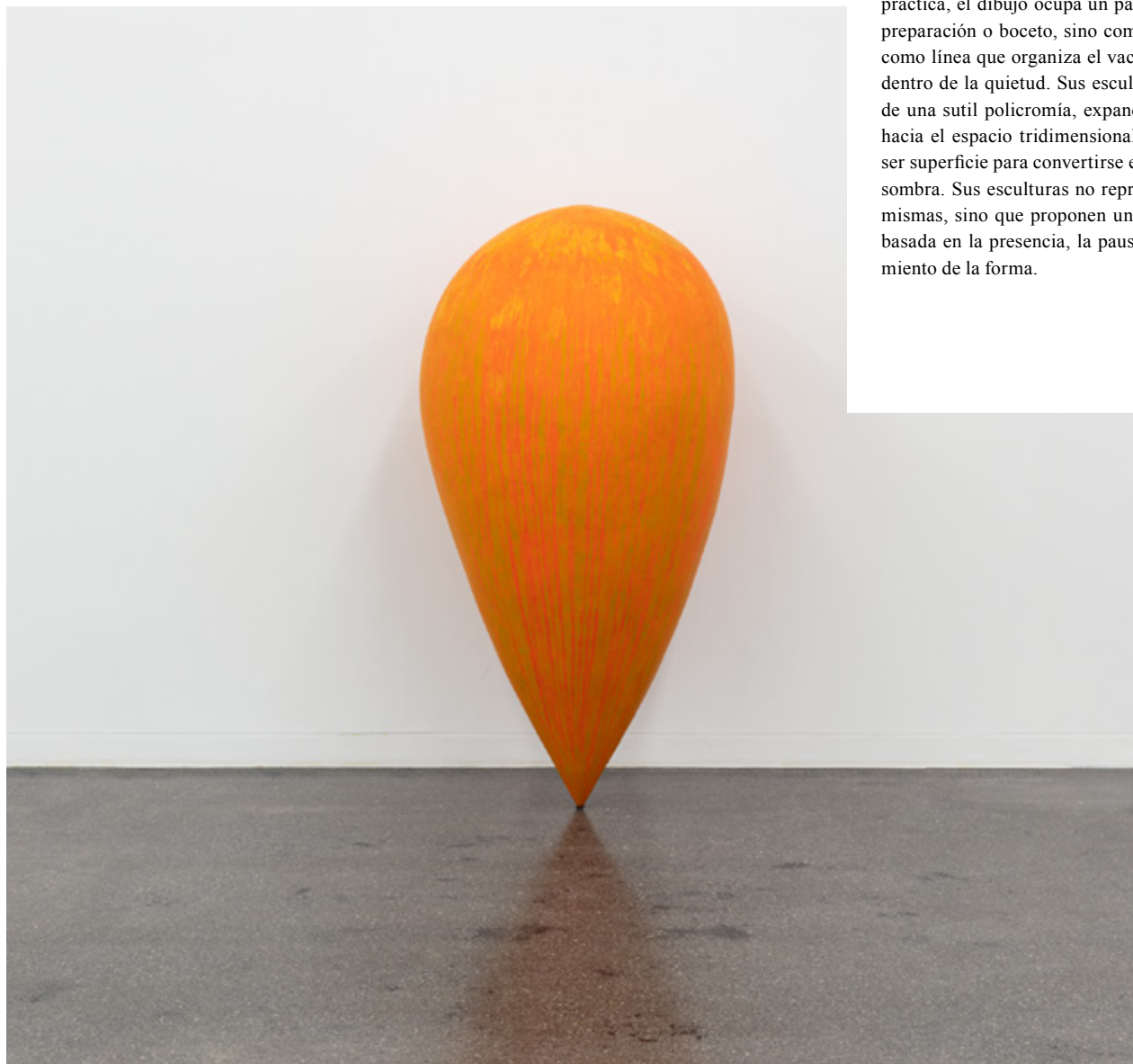
De la obra mirada (2001–2002). Acrílico y óleo sobre pasta de papel. Cortesía del artista.

El trabajo de José Herrera, de una sobriedad meditada, se articula a partir de la relación entre la luz, el vacío y la percepción, proponiendo una experiencia de contemplación silenciosa. Lejos de entender la escultura como objeto, Herrera la concibe como un lugar: una situación espacial donde los materiales –precisos y mínimos– dialogan con la arquitectura y con la presencia del espectador. La luz, modulada y contenida, no solo revela las formas, sino que construye el sentido de la obra, trazando un territorio de introspección y recogimiento. En su práctica, el dibujo ocupa un papel estructural: no como preparación o boceto, sino como pensamiento espacial, como línea que organiza el vacío y sugiere movimiento dentro de la quietud. Sus esculturas, a menudo dotadas de una sutil policromía, expanden la noción de pintura hacia el espacio tridimensional, donde el color deja de ser superficie para convertirse en atmósfera, vibración o sombra. Sus esculturas no representan nada fuera de sí mismas, sino que proponen una experiencia perceptiva basada en la presencia, la pausa del tiempo y el pensamiento de la forma.