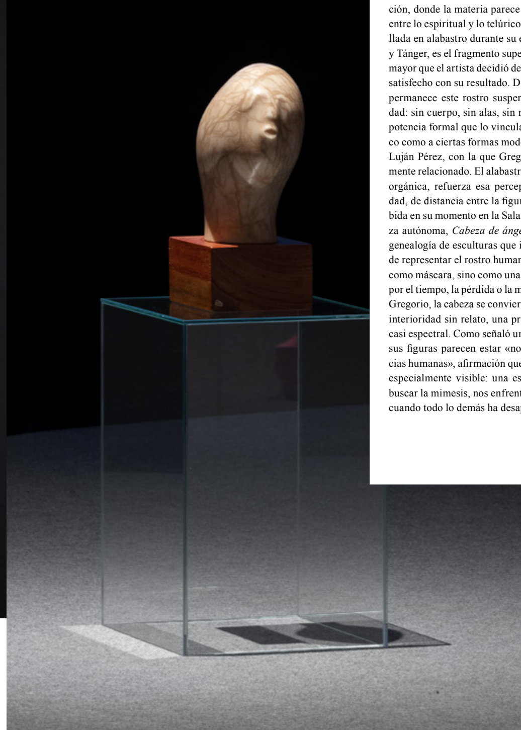
Eduardo Gregorio (Las Palmas de Gran Canaria 1903 – Ibídem, 1974) Cabeza de ángel (1969). Piedra maciza de alabastro. Colección TEA Tenerife Espacio de las Artes. Cabildo Insular de Tenerife.