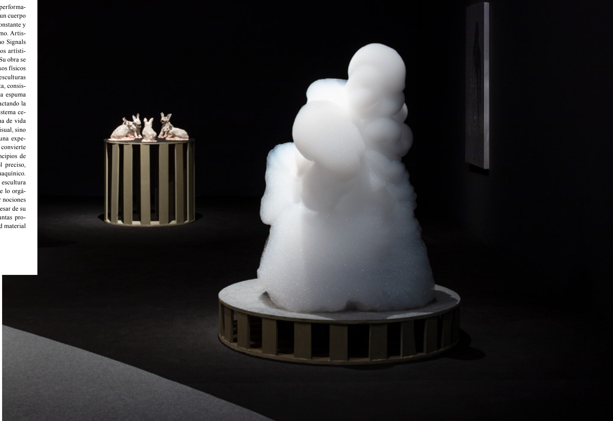
David Medalla, (Manila, Filipinas, 1941 – Ibidem , 2020) Cloud Canyons (Bubble machines auto-creative sculptures) (2016) Escultura bio-cinética con espuma.

Figura clave en los cruces entre arte cinético, performativo y experimental, David Medalla desarrolló un cuerpo de trabajo en el que la interacción, el cambio constante y la sensualidad de la materia cobran protagonismo. Artista autodidacta y nómada, fundó espacios como Signals Gallery en Londres y participó en movimientos artísticos que diluían las fronteras entre disciplinas. Su obra se caracteriza por integrar ciencia, poesía y procesos físicos inestables. Las llamadas Cloud Machines o esculturas bio-cinéticas, producidas desde los años sesenta, consisten en dispositivos mecánicos que emiten una espuma ligera en continuo ascenso. Las burbujas, refractando la luz como pequeños arcoíris, emergen de un sistema cerrado que se autorregula, sugiriendo una forma de vida artificial. Estas esculturas no solo apelan a lo visual, sino también a lo táctil y atmosférico, activando una experiencia contemplativa en el espectador, que se convierte en parte del sistema. La obra responde a principios de autoorganización, pero escapa a todo control preciso, desbordando los límites entre lo humano y lo maquínico. En ese sentido, Medalla propuso una idea de escultura como fenómeno transitorio y autónomo, donde lo orgánico y lo tecnológico se funden para cuestionar nociones de autoría, permanencia y objeto artístico. A pesar de su aparente ligereza, estas piezas plantean preguntas profundas sobre la vida, el tiempo y la precariedad material en el arte contemporáneo.