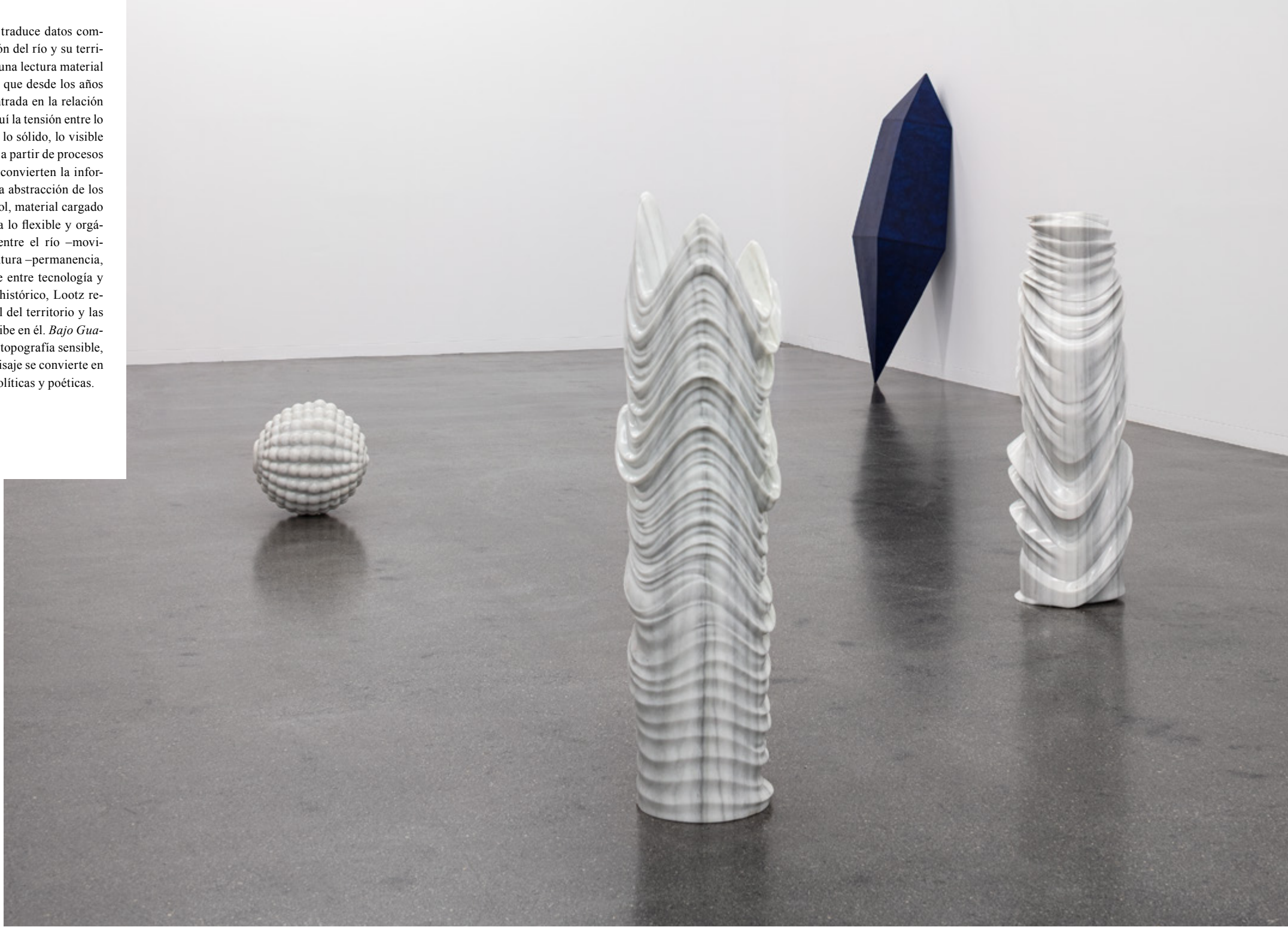
Eva Lootz (Viena, 1940) Bajo Guadalquivir (2009–2013). Mármol.

En Bajo Guadalquivir , Eva Lootz traduce datos complejos –relativos a la transformación del río y su territorio– en esculturas que proponen una lectura material y simbólica del paisaje. La artista, que desde los años setenta desarrolla una práctica centrada en la relación entre materia y lenguaje, aborda aquí la tensión entre lo natural y lo construido, lo fluido y lo sólido, lo visible y lo latente. Las piezas, elaboradas a partir de procesos digitales y esculpidas en mármol, convierten la información en forma, transformando la abstracción de los datos en presencia física. El mármol, material cargado de historia y peso, se contrapone a lo flexible y orgánico, evocando la contradicción entre el río –movimiento, tiempo, erosión– y la escultura –permanencia, contención, silencio. En este cruce entre tecnología y artesanía, entre lo geológico y lo histórico, Lootz reflexiona sobre la memoria material del territorio y las huellas que la acción humana inscribe en él. Bajo Guadalquivir se presenta así como una topografía sensible, donde los materiales hablan y el paisaje se convierte en un archivo de fuerzas históricas, políticas y poéticas.