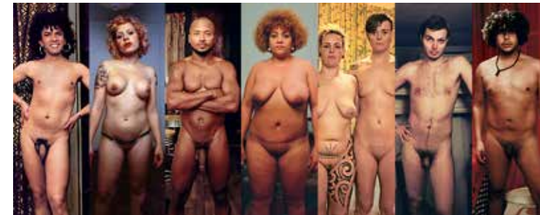
Fragmento de la instalación Back &amp; Forth, 2018

Constantly experimenting and engaging with autobiography, the work of the photographer and video artist Yapci Ramos (Tenerife, 1977) confronts us with the everyday realities and concerns of contemporary societies in different geographical contexts, making us face up to issues which are often still considered taboo even today.