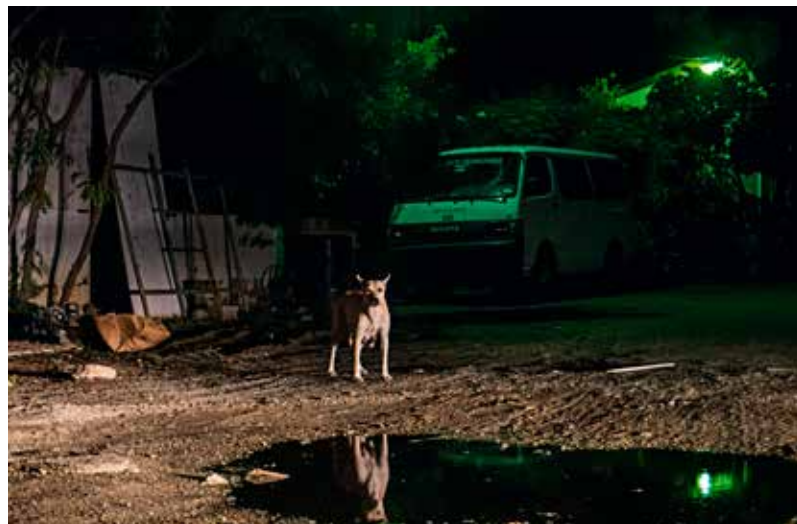
Perra 3, 2012, colección CAAM