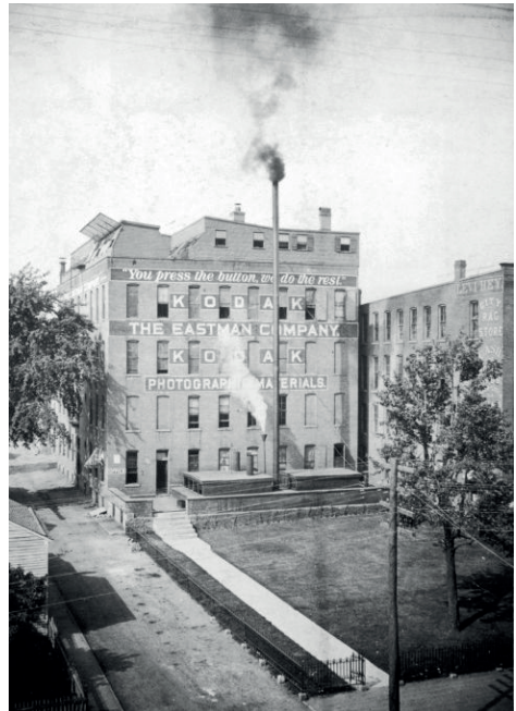
Exterior del edificio Kodak en Nueva York, donde se puede leer el lema de la marca (fin. s. XIX)