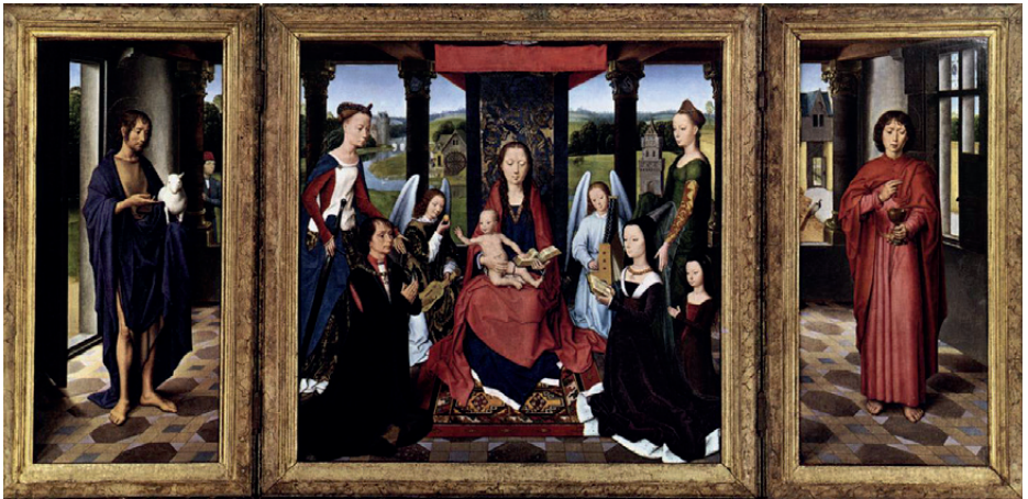
Tríptico Donne (1474) en el que se ve las figuras del donante John Donne, de su esposa y de su hija