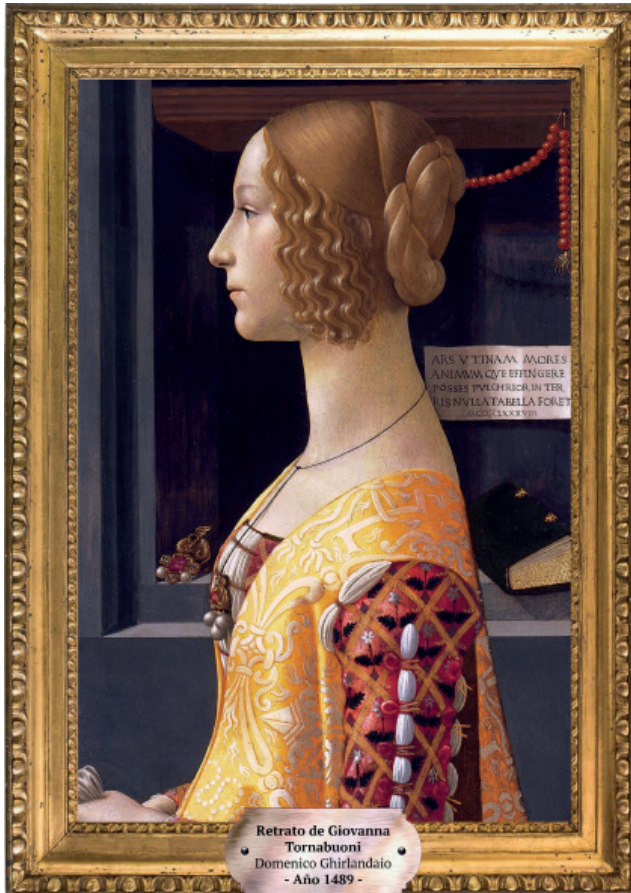
Retrato de Giovanna Tornabuoni Domenico Ghirlandaio - Año 1489 -

Con la llegada del Renacimiento y la reivindicación del antropocentrismo -frente al teocentrismo anterior- la práctica del retrato recuperó su importancia y este género empezó a proliferar como símbolo de la posición social . No obstante, a pesar de difundirse su práctica, siguió siendo privilegio de unos pocos y continuó vetado para la gran mayoría de la población.