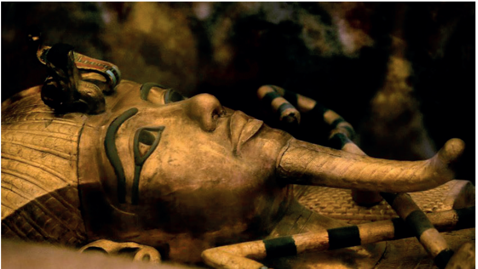
Detalle de sarcófago de Tutankamón

Fue durante el Imperio Romano, cuando se empezó a valorar que los retratos –especialmente los escultóricos– representaran las cualidades físicas de las personas, además de su alma y su carácter. No obstante, en la mayoría de los casos, exaltaban también la belleza y el poder de los retratados.