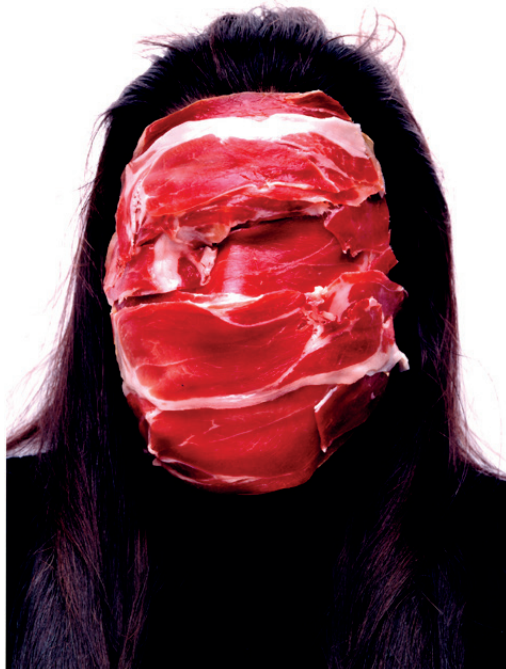
La máscara (jamón) (1997) J. Galán Serrano

Son retratos que, en lugar de facilitarnos respuestas, nos desafían con cuestiones cómo qué es la identidad , qué es lo que nos define y singulariza como individuos o cuál es la distancia que separa cómo nos ven los demás de la percepción que tenemos de nosotros mismos.