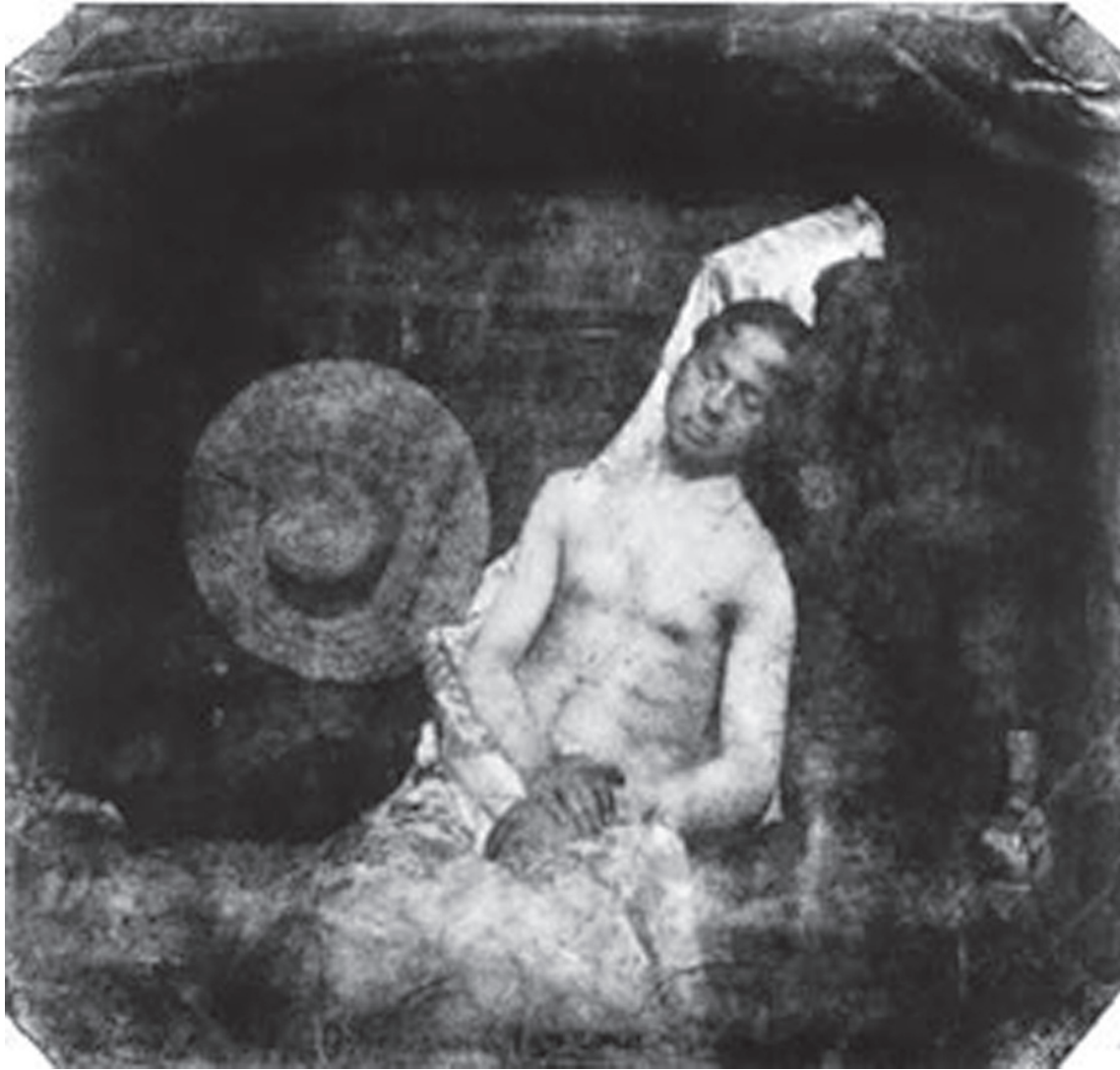
Hippolyte Bayard, El ahogado (autorretrato), 1840