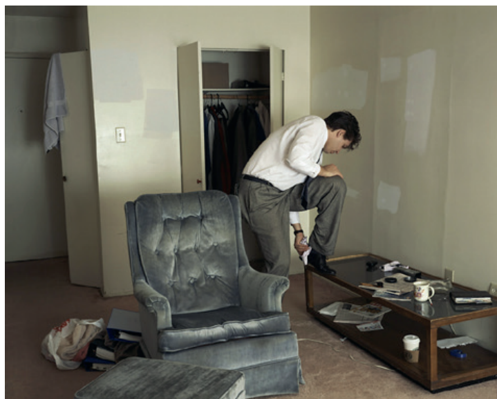
Jeff Wall, Polishing , 1998

La manipulación no es, pues, una práctica nueva. Los problemas derivados sí son, en cambio, más o menos recientes y están vinculados, además de a la cada vez más perfecta invisibilidad de aquélla, a la cantidad ingente de información visual que recibimos a diario y respecto a la que resulta realmente difícil mantenerse alerta.