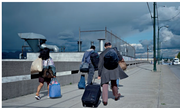
Jeff Wall, Overpass , 2001