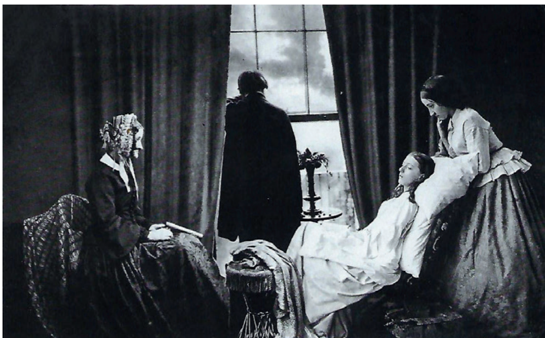
Henry Peach Robinson, Fading away (Desapareciendo), s/f

La identificación del medio fotográfico con el concepto de verdad es tan antigua como la propia fotografía. El hecho de que para hacer una fotografía sea necesaria la existencia real de un referente, vincula este medio a la realidad como no ocurre, por ejemplo, con otros procedimientos de representación, como la pintura. Un cuadro puede surgir de la nada, de un lienzo en blanco y de la pura imaginación del artista, pero para producir una fotografía debe existir primero ese objeto, persona o paisaje que, una vez fotografiado, aparecerá en la imagen.