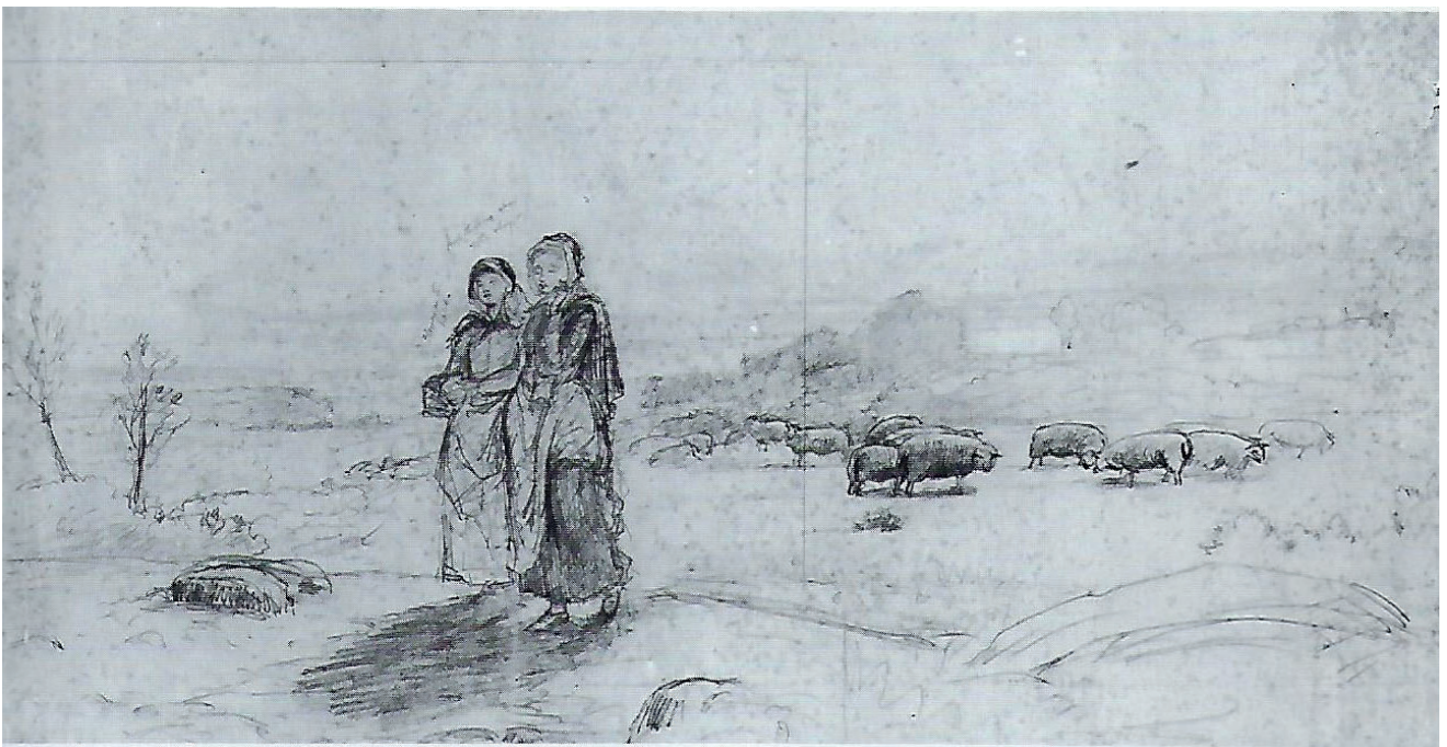
Henry Peach Robinson, Paseando (positivado y boceto preparatorio), 1887