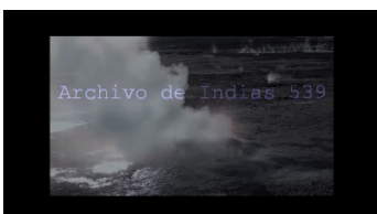
Archivo de Indias