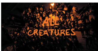
Todas las criaturas