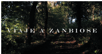
Viaje a Zanbiose