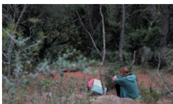
Hablando con el territorio natural